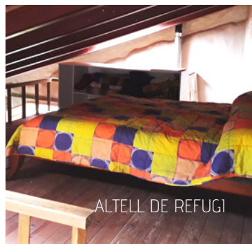
ALTELL DE REFUGI